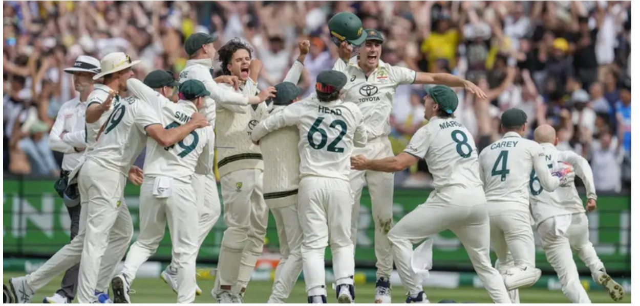
মেলবৰ্ণ টেষ্টত ভাৰতক ১৮৪ ৰানত হৰুৱাই অষ্ট্ৰেলিয়ান দলৰ উল্লাস, সোমবাৰে

গ্ৰাম্য পৰিৱেশৰ মাজেৰে বনভোজৰো অভিজ্ঞতা লোৱাৰ সুবিধা